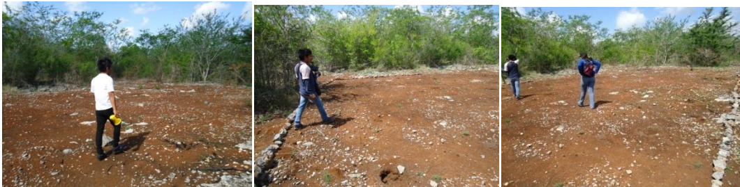
Figura 15.4 Limpieza y delimitación del área del sendero interpretativo.