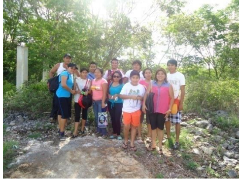
Figura 15.2 Imagen 3 Grupo organizado

La figura 4 y 5 muestra la limpieza y delimitación del área de acampado y el sendero interpretativo hecha por el grupo.