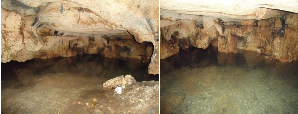
Figura 15.6 Segunda cámara del cenote